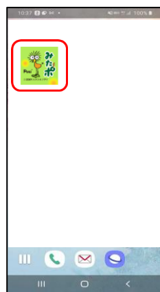
①アプリを立ち上げる