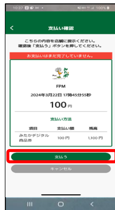
⑥お店側で金額確認後、⑦決済画面が表示されたら完了 お客様側で「支払う」をタップ

支払方法 「商品券」：商品券のみの利用 「みたかポ」：みたか地域ポイントのみの利用 「併用」：商品券とみたか地域ポイントの併用