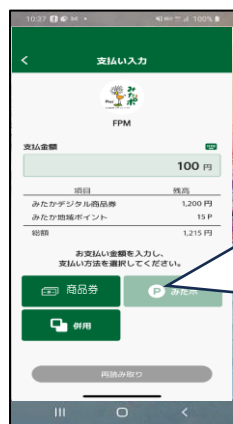
⑤利用金額を入力し、支払方法をタップ

支払方法 「商品券」：商品券のみの利用 「みたかポ」：みたか地域ポイントのみの利用 「併用」：商品券とみたか地域ポイントの併用